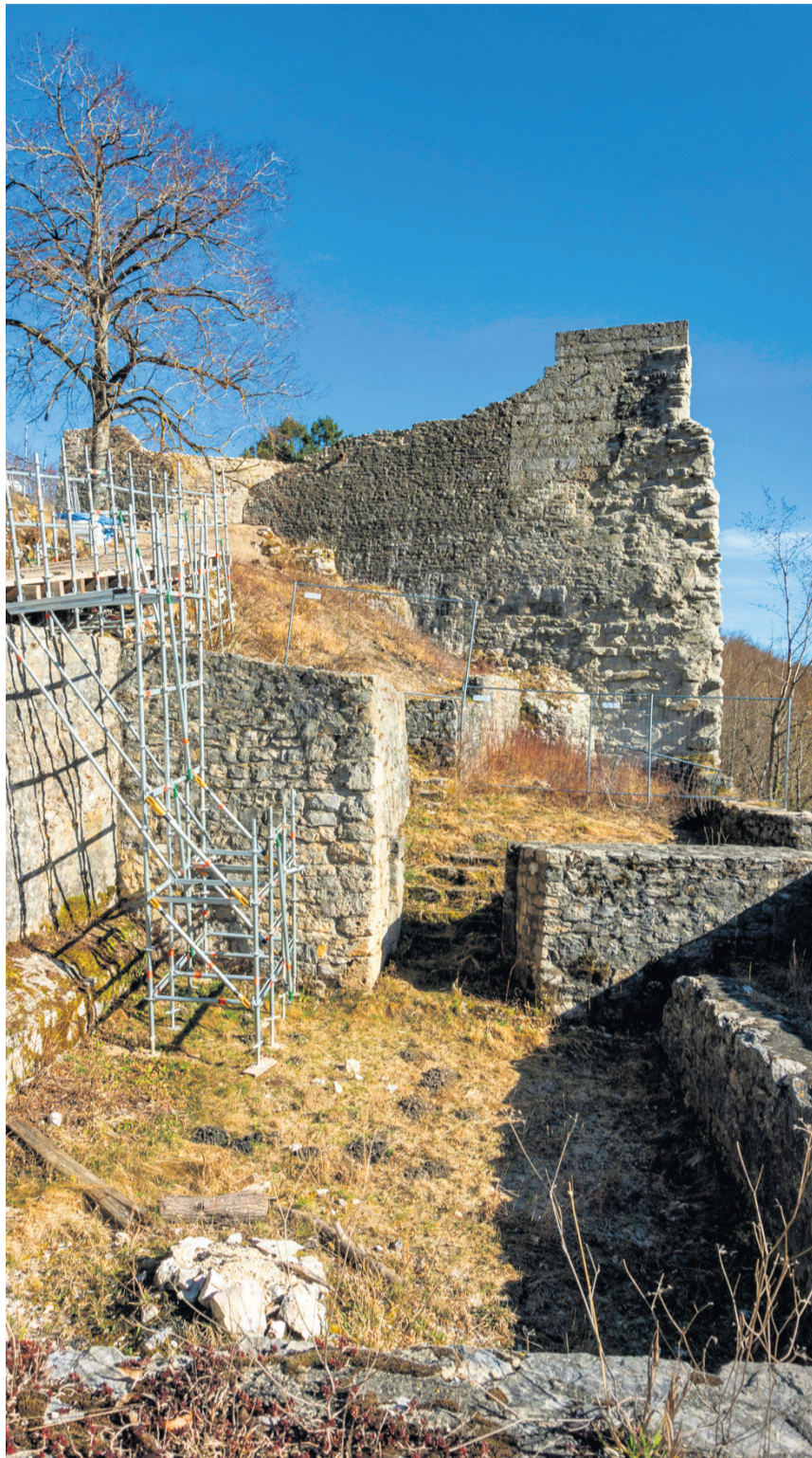
Die Burgruine Hohenwittlingen wird gerade aufwendig saniert.

Doch dieses Rusenschloss ist ein gutes Beispiel dafür, wie schwierig und teuer es mitunter ist, diese meist mittelalterlichen Anlagen zu sanieren. Zunächst musste dort ein Zufahrtsweg angelegt werden, um überhaupt das Material zu der abgelegenen Burgruine zu bekommen. Ein spezielles Hängegerüst am steilen Fels war notwendig – es kamen Helikopter und Alpinkletterer zum Einsatz. Zudem müssen alle Arbeiter mit den Gemeinden, den Denkmal- und den Naturschutzbehörden abgestimmt