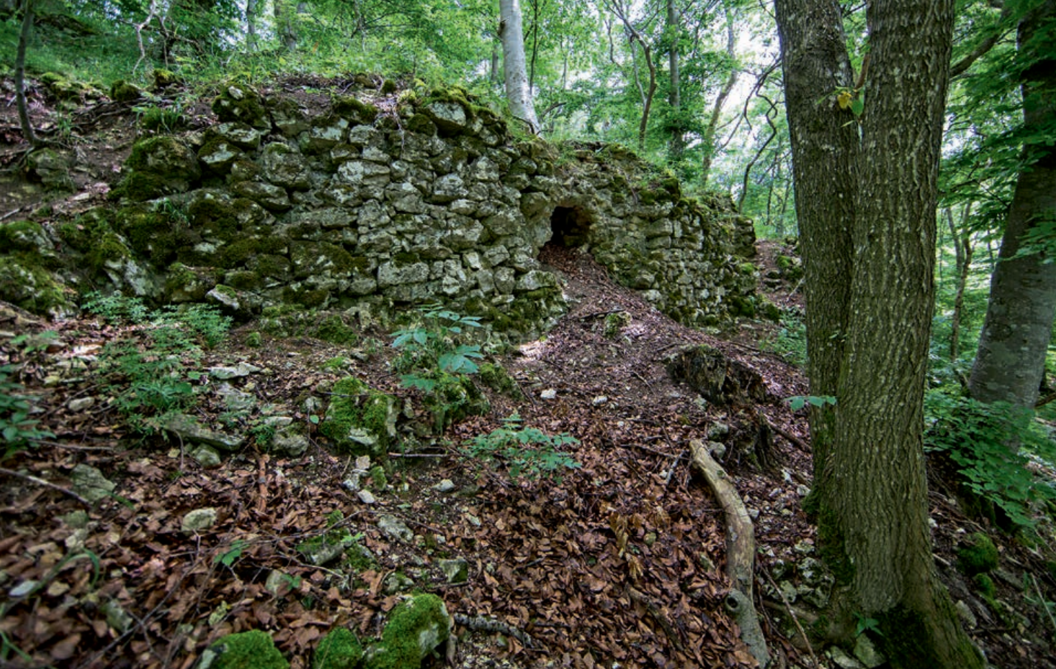
Ein Ort mit besonderer Magie: Verborgen im Wald liegen die Mauerreste. Ein besonderes Rätsel stellt das Holz in einem Stück Mörtel dar – es stammt nämlich aus dem 3. oder 4. Jahrhundert.

gangenen Jahres mit Vermessungen vor Ort erstmals ein 3-D-Modell des Geländes erstellt. Und Studenten der Universität Tübingen haben in einem Seminar Lesefunde von der Burgruine analysiert und zeitlich bestimmt. Mittlerweile wurden erste Unternehmen angesprochen, ob sie die weitere Erforschung der Ruine nicht finanziell unterstützen würden. Denn zu tun gibt es noch mehr als genug. Derzeit